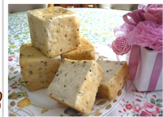
プチキューブパン・ごま